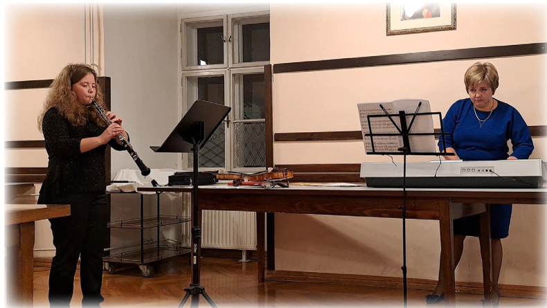
Glasbeni program za bogoslovce