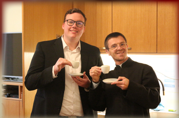
» Prefekt, kave bi ... «