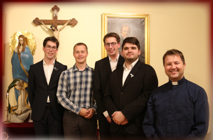
Novo vodstvo MKSBD