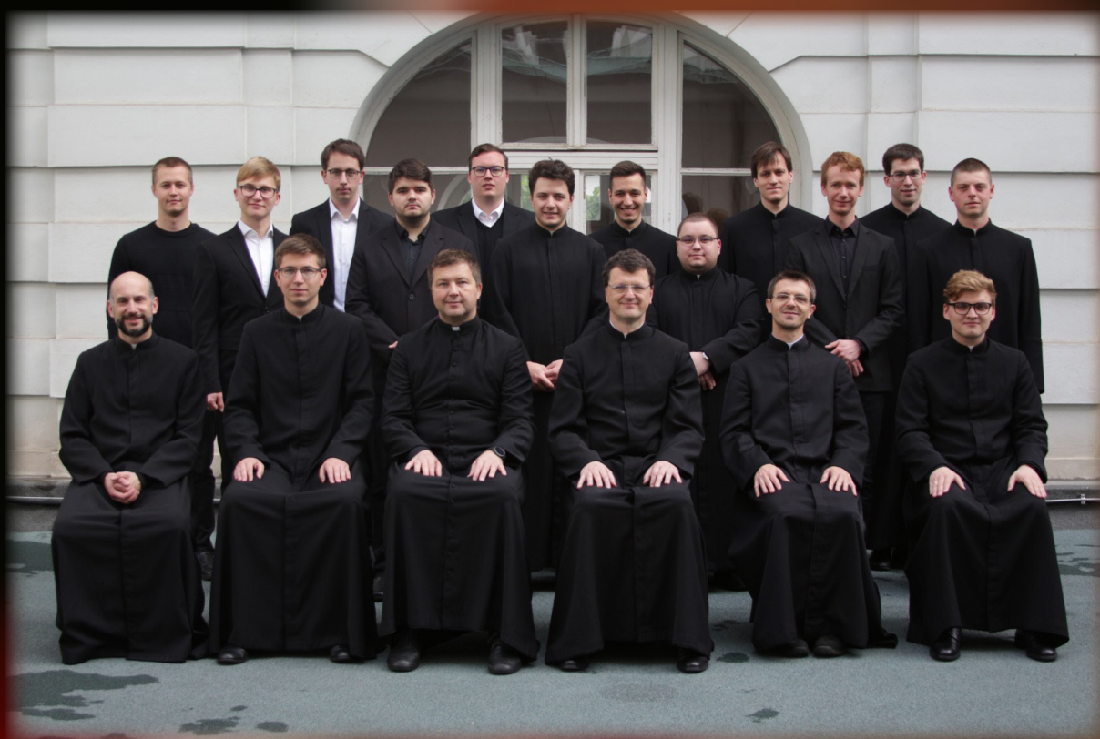
Slovenski bogoslovci 2022/2023