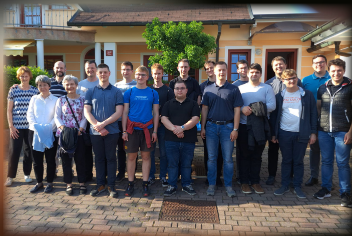
Zaključni piknik pri družini Venta