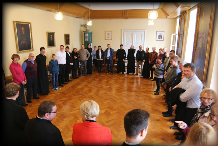
Srečanje s starši