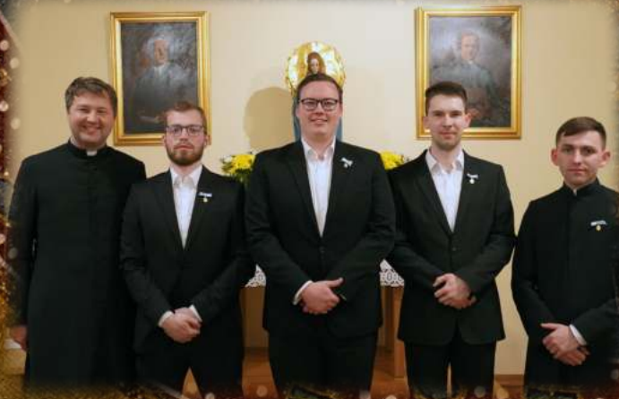
Novo vodstvo MKSBD