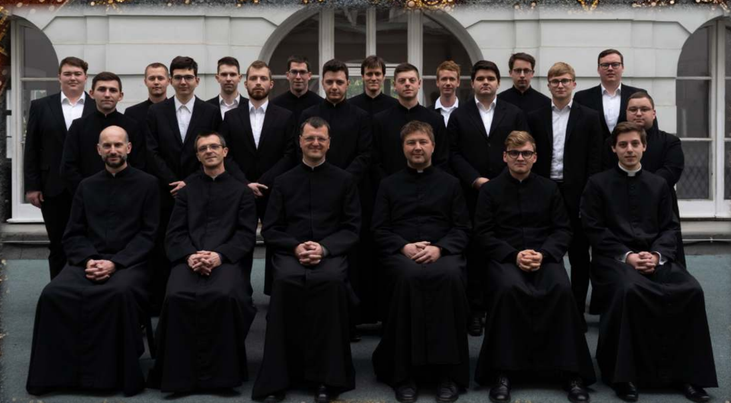
Slovenski bogoslovci in vodstvo 2023/2024